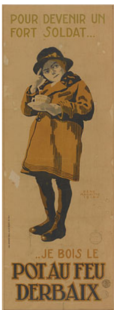
René Magritte, Pour devenir un fort soldat... , 1918, MRBAB ©