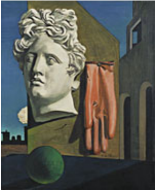
Giorgio de Chirico, Le Chant d'amour , 1914, New York, Moma