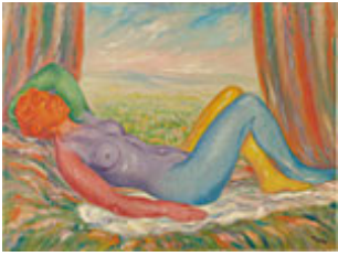
René Magritte, La Moisson , 1943