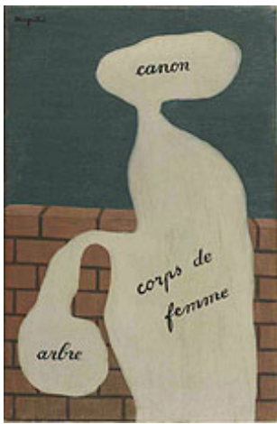
René Magritte, L'Arbre de la science , 1929