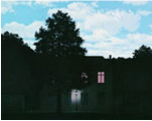
René Magritte, L'Empire des lumières , 1961, coll. privée