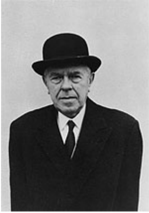
Duane Michals, René Magritte , 1967