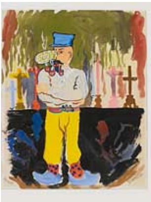
René Magritte, Le Crime du pape , 1948