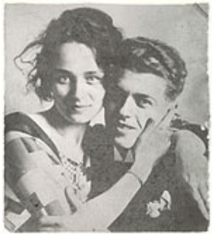
Georgette et René Magritte, 1922