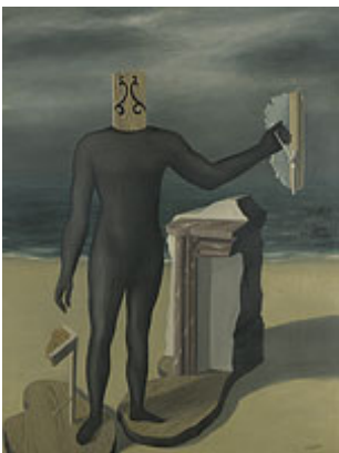
René Magritte, L'Homme du large , 1927, MRBAB