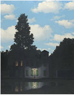
René Magritte, L'Empire des lumières , 1954