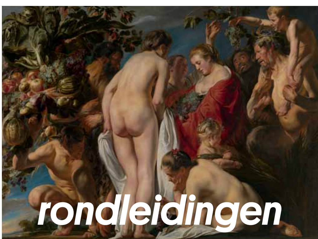
Jacob Jordaens, Allegorie van de vruchtbaarheid.